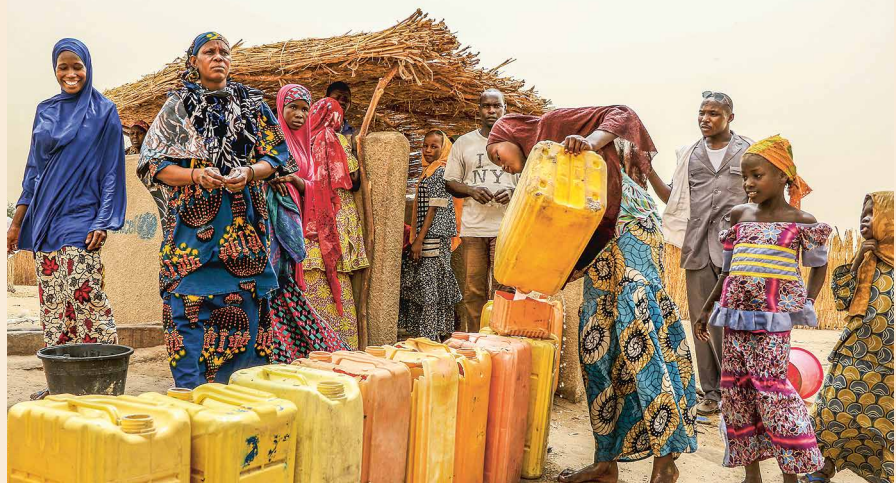
Säuberung von Kanistern an einer Trinkwasserstation von ÄRZTE OHNE GRENZEN

Ein Hepatitis-E-Ausbruch im Niger hat zu mehr als 870 Erkrankungen geführt, vor allem unter der vertriebenen Bevölkerung im südöstlichen Ort Diffa. Die Krankheit ist besonders für schwangere Frauen gefährlich. Da sich Hepatitis E leicht über verschmutztes Wasser überträgt, hat ÄRZTE OHNE GRENZEN neben der Behandlung der Erkrankten auch etwa 130 Wasserstellen eingerichtet, an denen Wasser mit Chlor desinfiziert wird. Außerdem verteilten unsere Mitarbeiter saubere Wasserkanister, Pakete mit Reinigungsmitteln und mehr als 36.000 Seifenstücke.