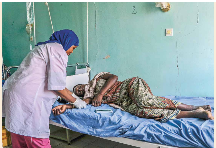
Diese Patientin leidet unter schweren Komplikationen im Zusammenhang mit ihrer Hepatitis-E-Erkrankung.